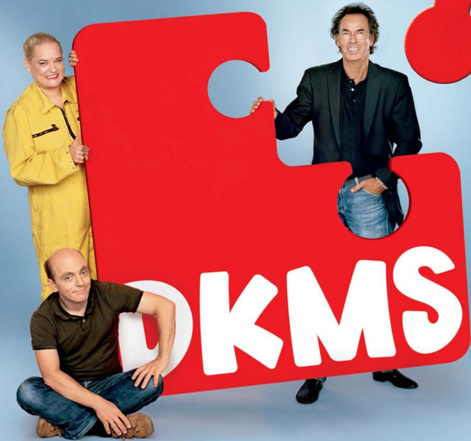
Hella von Sinnen, Bernhard Hoëcker, Hugo Egon Balder