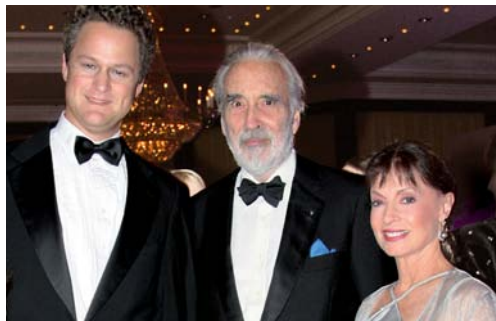
Florian Graf Henckel von Donnersmarck, Christopher Lee, H.R.H. Princess Elisabeth of Yugoslavia