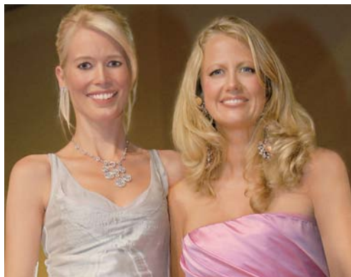
Claudia Schiffer, Barbara Schöneberger